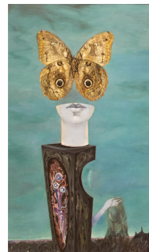
Toison d'or, 1937